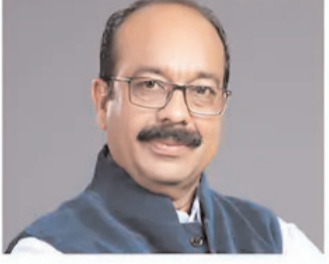
अरुण साव (डिप्टी सीएम)

सामान्य प्रशासन, खनिज संसाधन, ऊर्जा, जन संपर्क, वाणिज्य कर (आबकारी), परिवहन, अन्य विभाग जो किसी मंत्री के पास न हों