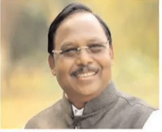
राम विचार नेताम

स्कूल शिक्षा, उच्च शिक्षा, संसदीय कार्य, धार्मिक न्यास एवं धर्मस्व, पर्यटन एवं संस्कृति