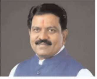
विजय शर्मा (डिप्टी सीएम)

लोक निर्माण, लोक स्वास्थ्य यांत्रिकी, विधि और विधायी कार्य, नगरीय प्रशासन