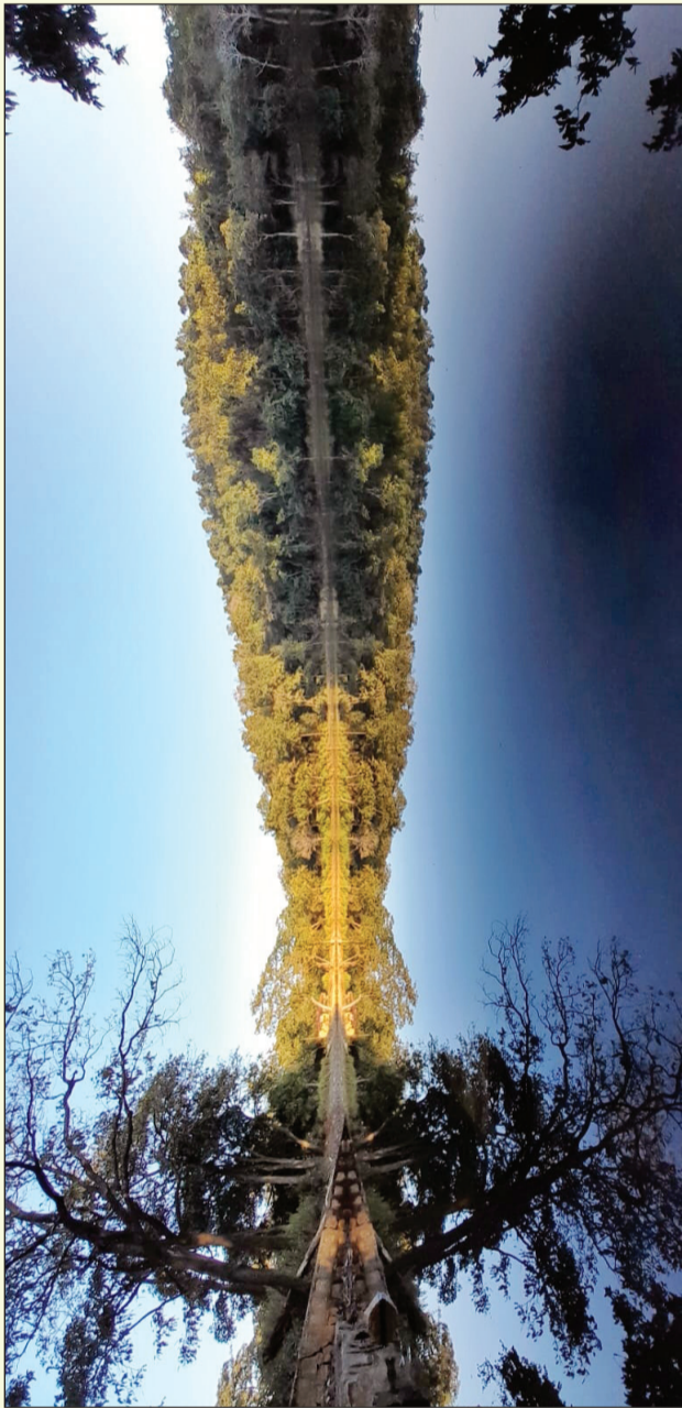
झों से लिया गया अद्भूत नजारा

जंगली जानवरों की आहट, पक्षियों के कलरव पहाड़ के ऊपर लबाबल जलाशय और सौंदर्य खिंच रहा पर्यटकों को