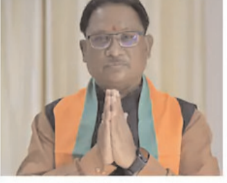
विष्णुदेव साय मुख्यमंत्री

मुख्यमंत्री विष्णुदेव साय ने विभागों के बंटवारे के बाद सभी मंत्रियों को बधाई दी है। उन्होंने कहा है कि विभागों का बंटवारा कर दिया गया है। सभी मंत्री अपने-अपने विभागों से अब जनता के हित के लिए कार्य करेंगे।