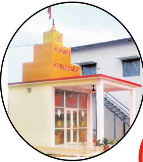
Maa Saraswati Mandir