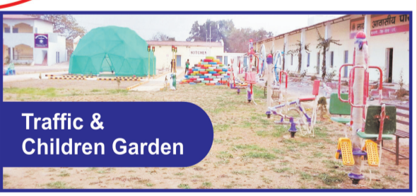
Traffic & Children Garden

To Give the best education to the Students with Modern techniques.