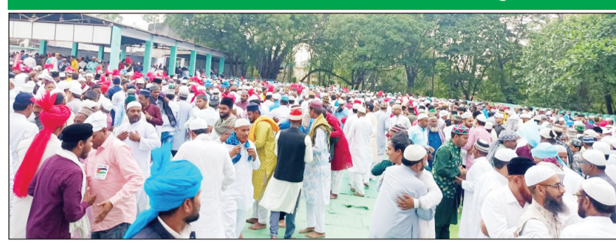
कोरबा (दिव्य आकाश)।

जिले की तमाम मस्जिदों-ईदगाहों में हुई नमाज