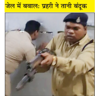
जेल में बवाल: प्रहरी ने तानी बंदूक