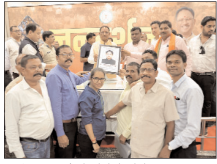
सीएम जनदर्शन में लोगों के होठों पर मुस्कान...