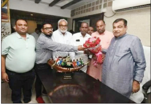
कोरबा/कटघोरा ( दिव्य आकाश )।