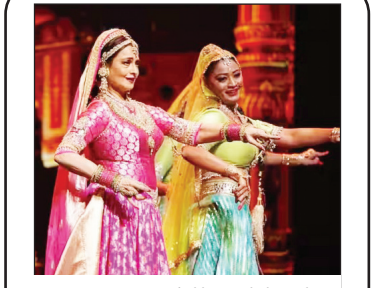
IIFA 2024 अवॉर्ड सेरेमनी में रेखा ने दी शानदार परफॉर्मेंस, पिक लहंगा-चोली में 90s वाले लुक से जीता सबका दिल

फिर उसे उच्च न्यायालय भेजा गया। वह एक दलित लड़का है जिसे इधर-उधर भटकना पड़ा है। कोर्ट ने संविधान के अनुच्छेद 142 का उपयोग करते हुए यह निर्णय लिया है। आर्टिकल 142 सुप्रीम कोर्ट को न्याय के हित में आदेश पारित करने की शक्ति देता है।