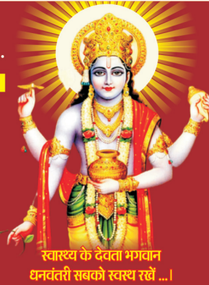
स्वस्थ के देवता भगवान धनवंतरी सबको स्वस्थ रखें...।

कोरबा से प्रकाशित एवं मुद्रित प्रथम बहुरंगी साप्ताहिक अखबार