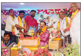
कोरबा (दिव्य आकाश)।