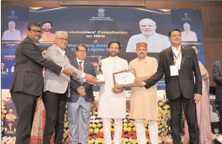
नई दिल्ली में कोयला एवं खान मंत्री जी. किशन रेड्डी एवं कोयला एवं खान राज्य मंत्री सतीश चंद्र दुबे द्वारा विजेताओं को किया गया पुरस्कार