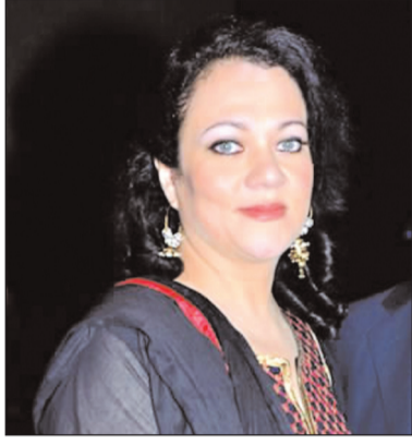
कोरबा ( दिव्य आकाश )।

10 वर्ष पूर्व कोरबा शिक्षा जगत के लिए एक एतिहासिक दिन था, जब जिले के वनांचल क्षेत्र कोरबा-चाम्पा मार्ग खरहरकुड़ा (मड़वारानी) में एक ऐसे विद्यालय का अभ्युदय हुआ, जो ग्रामीण एवं गरीब बच्चों का भविष्य सुधारने का बीड़ा उठाया और सर्वोत्कृष्ट अंग्रेजी सीबीएसई माध्यम से शिक्षा देने लगा। आज यह विद्यालय कोरबा जिले का ही नहीं बल्कि प्रदेश का सर्वोत्कृष्ट विद्यालयों में शुमार है और वटवृक्ष की तरह अपनी छाया में हजारों ग्रामीण एवं निर्धन बच्चों का भविष्य उज्वल बना रहा है। नितेश कुमार