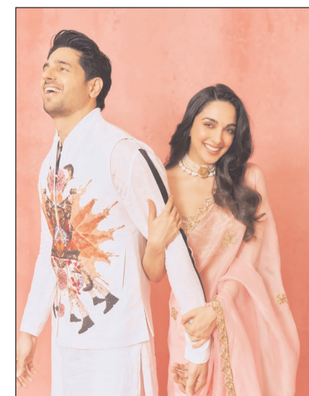
NMACC इवेंट के बाद Siddharth-Kiara का रोमांटिक फोटोशूट, Traditional Look में जीता फैंस का दिल