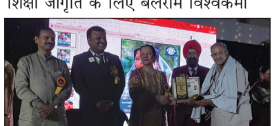
लायनिज्म के लिए पीडिजी एमडी माखिजा