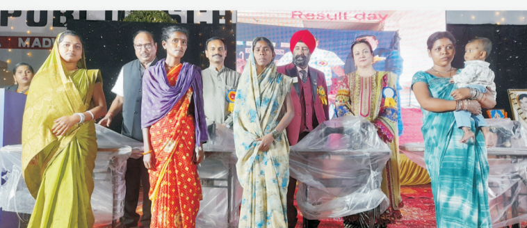
महिला सशक्तिकरण : एनकेएम लायंस पब्लिक स्कूल/ लायंस क्लब कोरबा गुरुकुल ने चार ग्रामीण महिलाओं को सिलाई मशीन भेंट की।

सम्मान समारोह के प्रथम सत्र के बाद विद्यालय के बच्चों द्वारा राम तेरी गंगा मैली के सुप्रसिद्ध गीत सुन साहिबा सुन प्यार की धुन और एक राधा एक मीरा गीत में नृत्य प्रस्तुति दी गई, जिसमें फिल्म अभिनेत्री ने भी बच्चों के साथ मिलकर अपनी सहभागिता दी। इसके बाद पुनः सम्मान समारोह के द्वितीय सत्र में ग्रामीण अंचलों के सरपंच, पंच, मितानिन, आंगनवाड़ी कार्यकर्ताओं एवं अन्य समाजसेवियों का भी सम्मान किया गया। साथ ही बसंत पंचमी के अवसर पर विद्यालय के नव प्रवेशित बच्चों को गणवेश एवं पठन सामग्री का वितरण किया गया। विद्यालय की ओर से ग्रामीण अंचल के 4 चयनित महिलाओं को सिलाई मशीन प्रदान की गई, ताकि महिला सशक्तिकरण को बढ़ावा मिल सके और महिलाएं आत्मनिर्भर एवं खुशहाल जीवन की ओर पायदान रख सकें। बरपाली तहसील कार्यालय के लिए आर.ओ.वाटर क्लर का निःशुल्क वितरण अतिथियों के