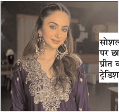
सोशल मीडिया पर छाया रकुल प्रीत का ट्रेडिशनल लुक