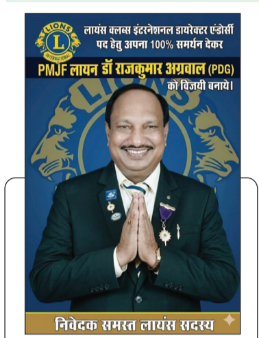
निवेदक समस्त लायंस सदस्य