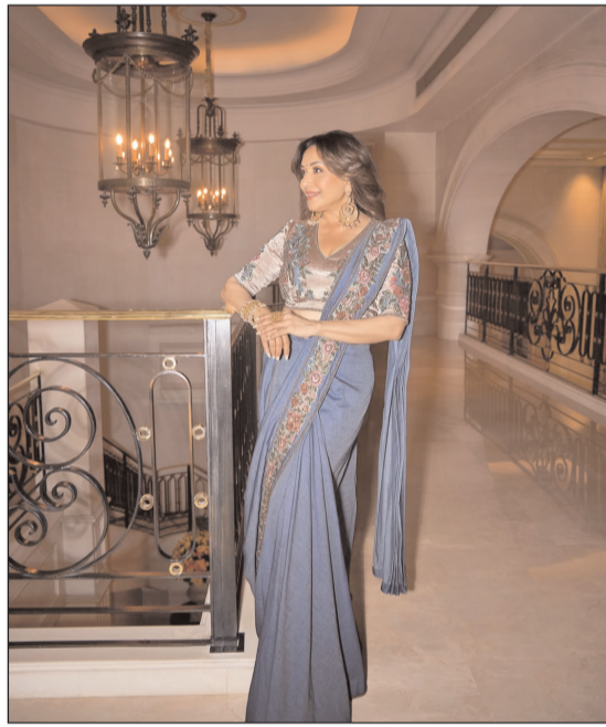
59 की उम्र में भी माधुरी की जवानी झलकती है

हम उस दिन गर्व करेंगे, जब शहर के घरों पर फिर गौरव्या चहकेगी, विलुप्त होते जीव फिर से जंगल के रौनक बनेंगे। एनएच के किनारे-किनारे धूप से राहत के लिए हरियाली दिखेगी, सीसी रोड के अगल-बगल में पाताल में पानी जाने के लिए उपाय किए जाएंगे। जब वातावरण में प्लास्टिक का एक टुकड़ा भी नहीं दिखेगा। गांव-गांव जलाशय, तालाब, कुएं दिखेंगे और हमें हर जगह 10 फीट पर पानी उपलब्ध होगा। जंगल कटने से वीरान धरती फिर हरियाली से आच्छादित होगी। जब हमारी दैनिक दिनचर्या में प्रकृति का संरक्षण और संवर्धन प्राथमिकता में होगा तो वह दिन दूर नहीं, जब माँ भारती की आंचल में स्वच्छ, सुंदर और हरित पर्यावरण दिखेगा।